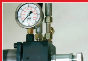
Regulace upínacího tlaku svěráku Vice clamping pressure regulation Spanndruckregulierung