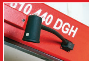
Halogenové osvětlení prac. prostoru Halogen lighting of workspace Halogen-Arbeitsleuchte