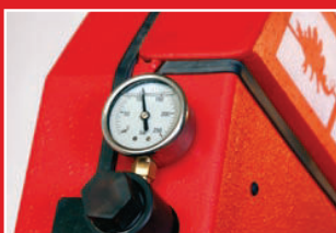
Hydraulický ukazatel napnutí pil. pásu Hydr. band tension indicator Hydr. Bandspannungsanzeige